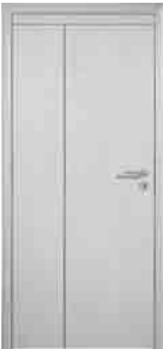
Ansicht | Falt-Türelement